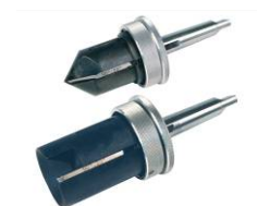
Fraises avec butées de profondeur (TUBOGRAT K)